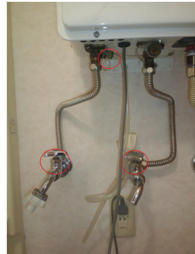
⑤湯沸し器の水抜きです 赤丸印の蛇口2ヶ所と透明チューブの付け根にあるネジを緩めます 洗濯機ホースが接続されていると思いますが外して下さい。湯沸器はコンセントを入れて通電されている状態だと凍結予防ヒーターが働きます