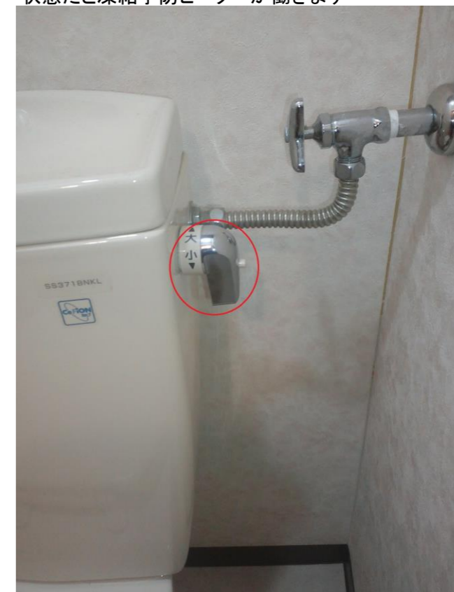
⑨WCです レバーを大に廻してタンクの水を空にして下さい

最後に長期不在にされる場合は排水トラップに不凍液を入れておくと凍結しません。ホームセンター等で購入出来ますのでご利用下さい。排水トラップは台所・洗面台・ユニットバス・WCにあります。水道凍結はお客様の責任となり修理代が高額なるケースもありますのでご注意下さい。写真は代表的な設備になりますので各お部屋によって設備が異なる場合があります。ご不明な点、質問事項がございましたらお問合せ下さい。