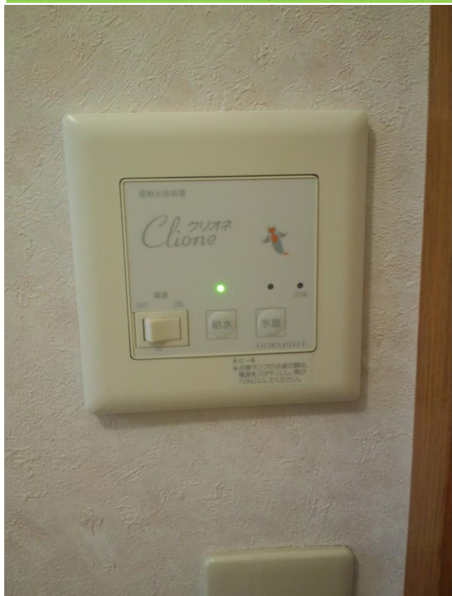
①電動水抜き装置リモコン部の電源を入れて水抜きボタンを押します