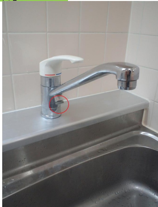
②台所のレバーハンドルを真ん中の位置で上に上げて水を出します ③赤丸印のネジを緩める