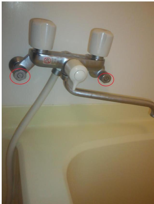
⑧UBの混合水栓です 水・お湯ハンドルを開けてシャワーホースを床に置き、赤丸印のネジを緩めます