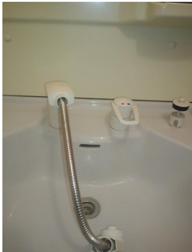
⑥洗面台のレバーハンドルを真ん中の位置で上に上げて、シャワーホースを下に下げ水を出します