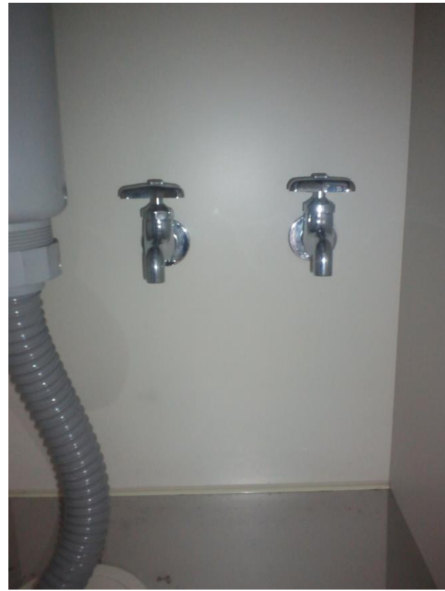
④台所下にある蛇口を洗面器等を用意した上で開けます