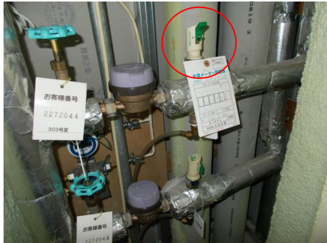
①赤丸印のレバーを「とめる」の方向にする。