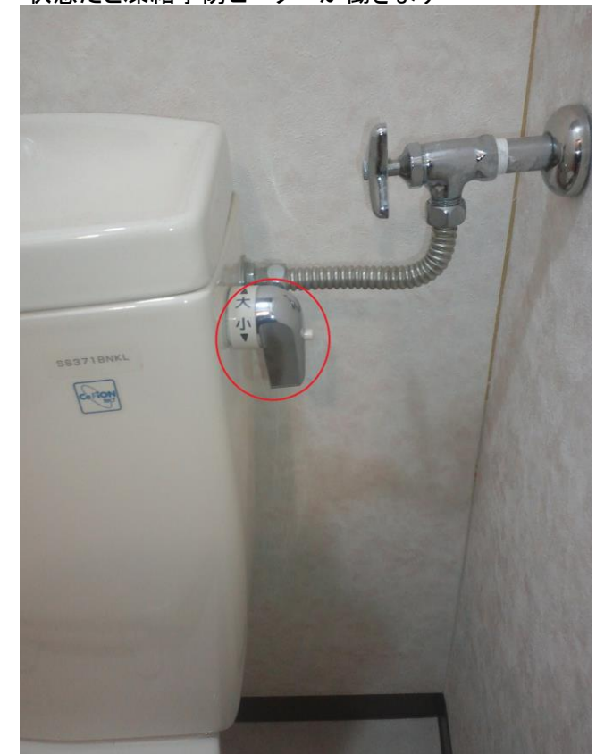
⑨WCです レバーを大に廻してタンクの水を空にして下さい

最後に長期不在にされる場合は排水トラップに不凍液を入れておくと凍結しません。ホームセンター等で購入出来ますのでご利用下さい。 排水トラップは台所・洗面台・ユニットバス・WCにあります。水道凍結はお客様の責任となり修理代が高額なるケースもありますのでご注意下さい。 写真は代表的な設備になりますので各お部屋によって設備が異なる場合があります。ご不明な点、質問事項がございましたらお問合せ下さい。